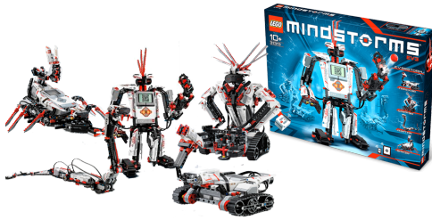
Figura 1: Kit LEGO Mindstorms EV3.

opción para los más pequeños. RobotC [19], ideal para usuarios con ganas de iniciarse en la programación C. También existen módulos disponibles para Matlab [13] y LabView [15], permitiendo la programación en sus propios lenguajes.