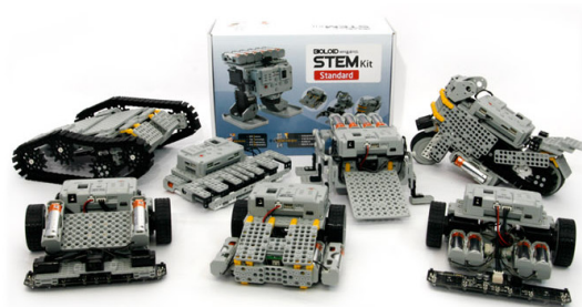
Figura 7: Robotis STEM.

Robotis STEM [22] es un kit de robótica modular que permite realizar 7 montajes de diferentes robots y que además cuenta con la posibilidad de expandir el kit básico, aumentando el número de montajes posibles hasta 9. En la Figura 7 se muestra el kit Robotis STEM, así como algunos de los posibles montajes.