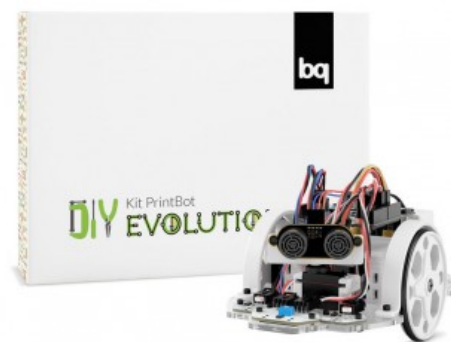
Figura 5: Bq Kit PrintBot Evolution.

Los kits de robótica empezaron a comercializarse en 2012. Además, proporcionan una plataforma online en la cual muestran contenido multimedia de cómo usar sus productos.