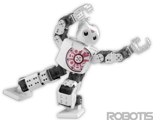
Figura 8: Robotis Darwin-Mini.

El robot mini-humanoide Darwin-Mini [20], el cual se muestra en la Figura 8, es un robot desarrollado por Robotis como iniciación a la robótica humanoide. Este robot está inspirado en su hermano mayor, el robot Robotis Darwin. El robot Darwin-Mini cuenta con 16 grados de libertad y su montaje se realiza de manera sencilla, ya que utiliza los mismos conectores que el sistema STEM.