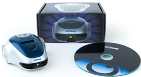
Figura 6: Kit básico de mOway

La estructura del robot no tiene un diseño modular, pero si tiene diferentes ampliaciones de las que se puede disfrutar. También proporciona compatibilidad con RaspberryPi.