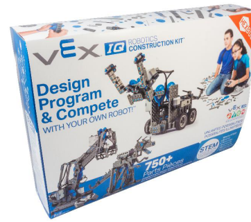
Figura 2: Kit VEX IQ.

Hay distintos softwares para programar esta plataforma, como Modkit [14] y EasyC [4], ambos