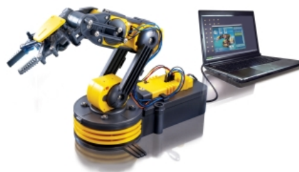
Figura 9: Cebek Brazo robótico Cebekit.

El software que ofrece para programar sus kits es monoplatforma (Microsoft Windows) y consiste mayormente en una interfaz de teleoperación y grabación de movimientos prefijados que luego pueden reproducirse.