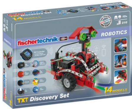
Figura 3: FischerTechnik ROBOTICS TXT Discovery Set.